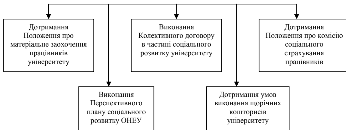
Схема виконання заходів фінансово-економічного та соціального розвитку Одеського національного економічного університету